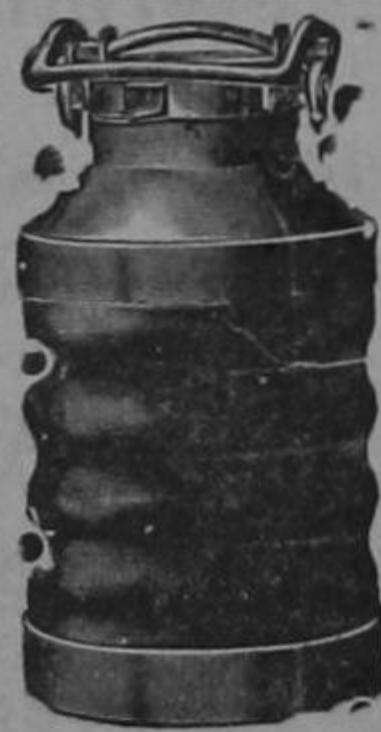
Almacenes al por mayor